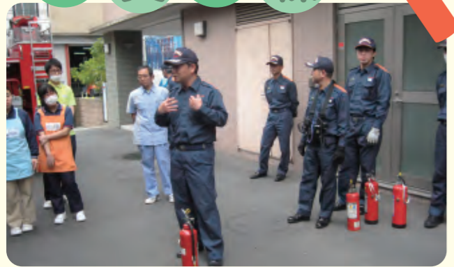
消火器等の使用方法を学びました。