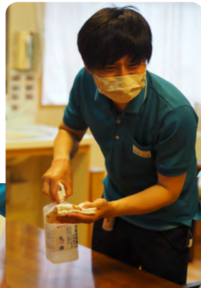
ワンケアワン消毒