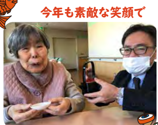
今年も素敵な笑顔で