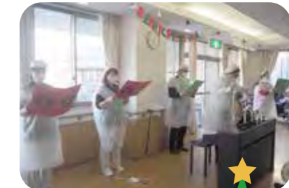
事務所から聖歌隊がきました