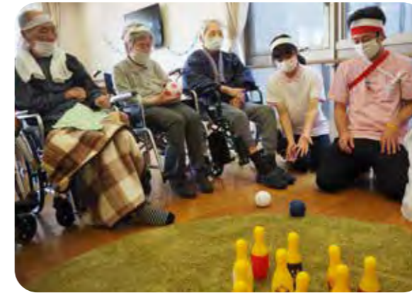
ポッチャ 真剣勝負