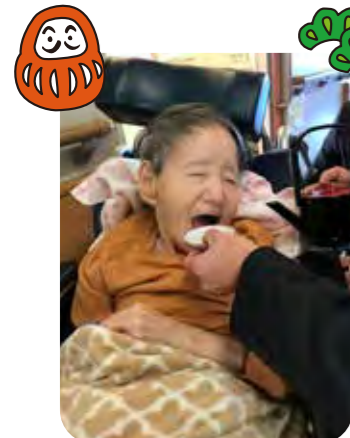
嬉しいと鼻歌でるのよ♪