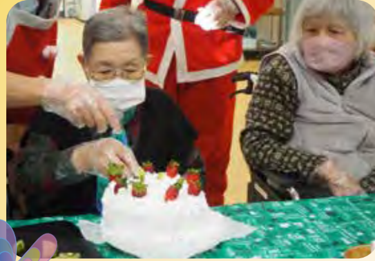
なかなか、良い感じだぞ