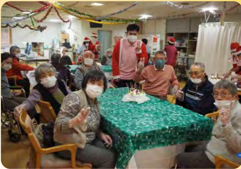
フルーツたっぷり、おいしそう!