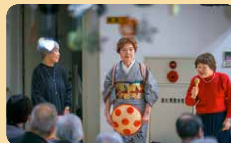
セッカーズの皆さま

10月26日、ふれあいフェスタが開催されました。お天気は残念ながら雨のため、室内での開催となりました。屋台では焼きそば、フランクフルトなどの販売があり、皆さまに召し上がって頂きました。また、セッカーズの方々の歌や三味線の披露や、職員によるソーラン節などの出し物もあり、大いに盛り上がりしました。皆さま、ご家族とのひと時を楽しまれていました。