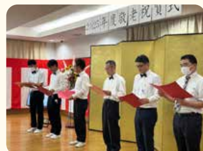
職員も一生懸命歌いました