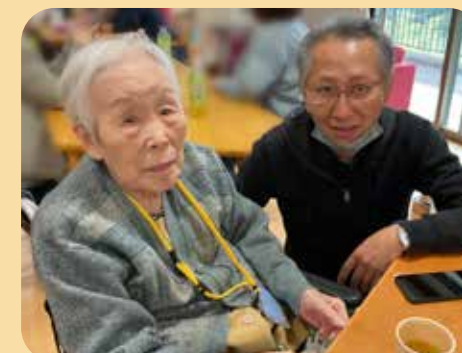
今日は楽しまなくちゃね