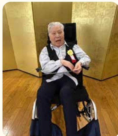
お祝いありがとう♪