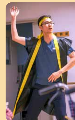
ソーラン節いくぜ!