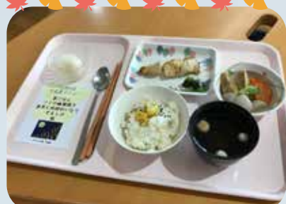
食欲の秋、いただきます