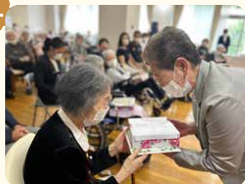
プレゼント、嬉しいです♪