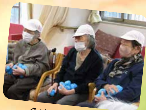
負けてられないわ！