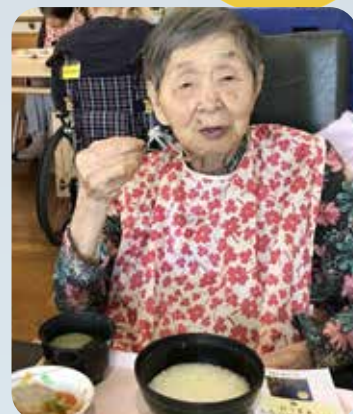
食べすぎちゃうかも