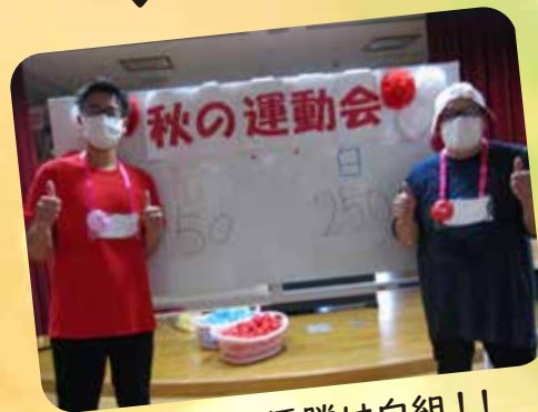
今年の優勝は白組！！