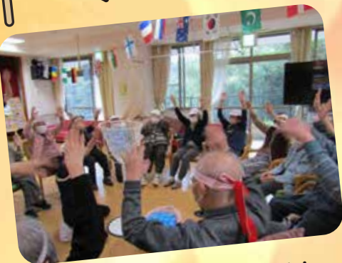
準備運動はしっかりと！！