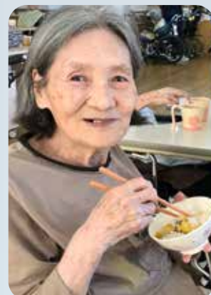
ホクホクして美味しい