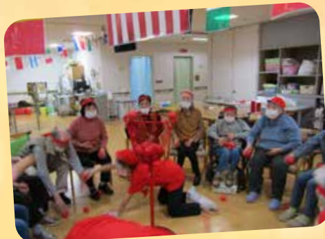
いっぱいいますよー！！