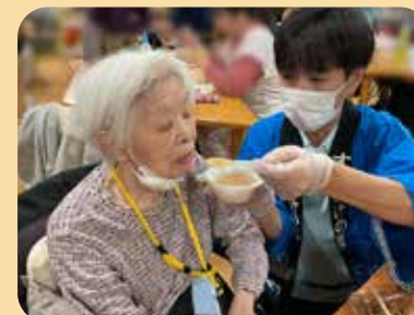
豚汁、アツアツです