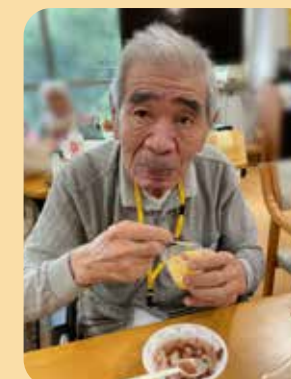
お味はどうですか?