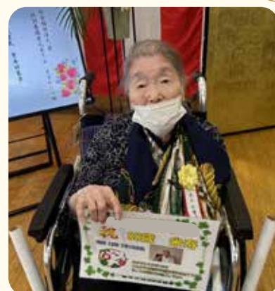
忘れられない良い思い出