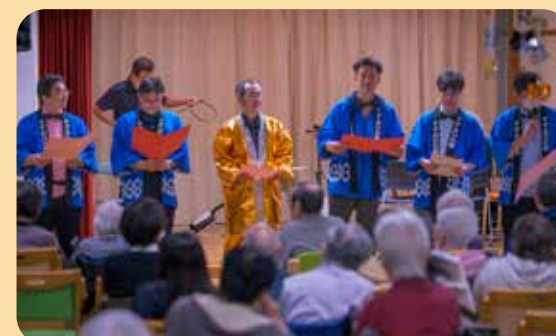
シティボーイズ参上