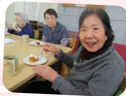
おいしくいただきます