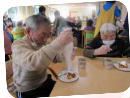
生クリームたっぷりつけて!