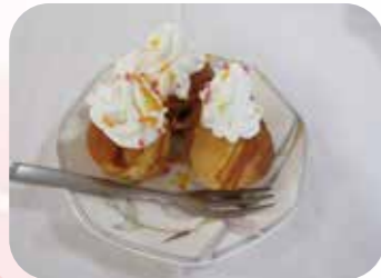
きれいに出来ました、鈴カステラ