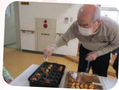
うまく焼けてきた!