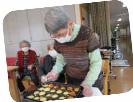
いい色に焼きあがってきた