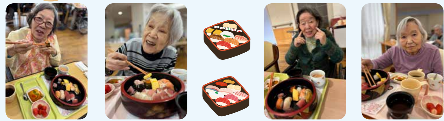
美味しゅうございます 玉子大好き ほったた落ちるぐらい美味しい 今日のご馳走ね