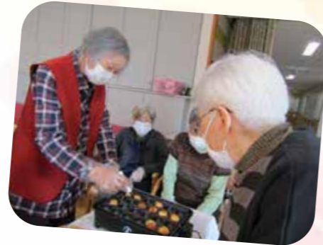
みんなでくるくる