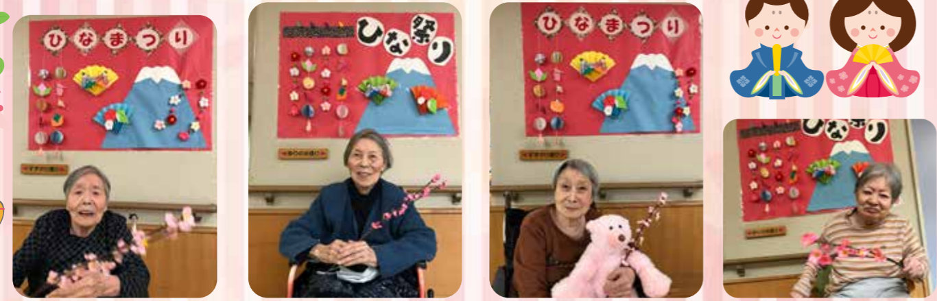
可愛く撮ってね ステキな笑顔 クマも桃色 桃の節句よ

3月3日はひな祭り。 桃の花を持って、とびきりの笑顔でハイポーズ。 何か良いことがあります。