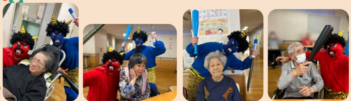
私、怖くないもん 私だって怖くないもん 青鬼さんと一緒よ コッソ!赤鬼退治

今年もすずかけの郷に赤鬼・青鬼がやって来ました。 「鬼は外～!福は内～」と豆に見立てたボールをカー杯投げて、 無病息災を願いました。